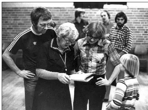
Er der mon styr på alle holdene?